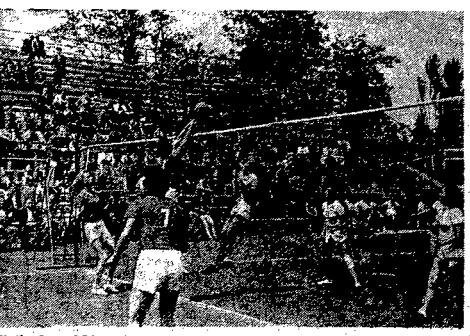
Skatarki polskie zajęły 3 miejsce na mistrzostwach Europy. Na zdjęciu: moment spotkania naszego zawodniczki z mistrzowską drużyną ZSRR na lodowisku stadionu w Pradze.