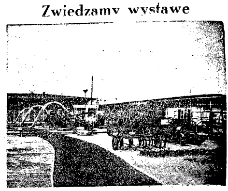
Wesorej i dziś — to bogaty dział maszyn rolniczych na Wystawie, obrazujący dorobek Polski Ludowej na polu rozwoju rolnictwa. Dział ten budzi duże zainteresowanie wśród zwiedzających Wystawę rolników.

Po przyjęciu kilku drobnych poprawek, budżet na rok 1950 został jednym większym przyjęty przez plenum MRN. W dalszym ciągu posiedzenia województwa i powiatowego z działalności Nadzwyczajnej Komisji dla poprawy bytu klasy robotniczej.