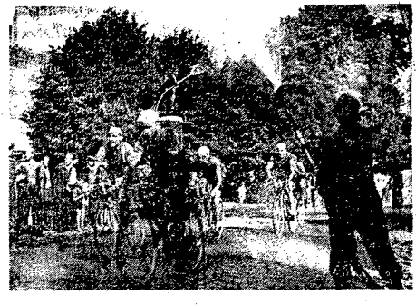
Ochotnica Straż Pożarna wyzdławiła kolarkom w jednej miejscowości kąpiel deszczową z sikawek.