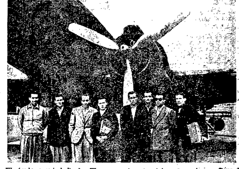
W drodze przyjeżdżali do Warszawy pierwsi goście z zagranicy na Tour de Pologne, który zaczyna się 22 sierpnia w Włocławku — w tym pierwszemu ośmiu. Długo im paszporty na wszystkie kraje Europy, poza Polską w której Tour się odbywa. Imię tych senków przyjeżdża. Na zdjęciu kolektor na lotnisku