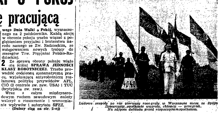
Ludowe zespoły po raz pierwszy rozegrały w Warszawie mecz ze Spółką... Na zdjęciu defkada przed rozpoczęciem spotkania.