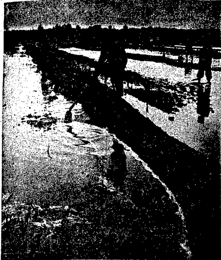
Wzrostą bogactwa i dobrobytu w Węgrzech, domowej nieżyłby... doświadczeniem wieloletnim polim wznowim.