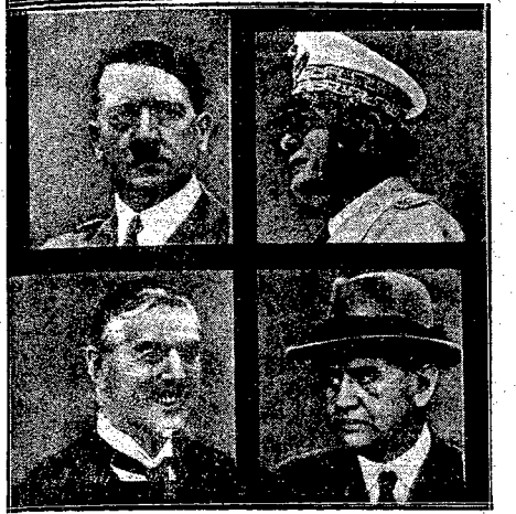
Nazwane największego wroga Polski i jego sprzymierzeńca oraz kapitulanta monarchii austriackiej, w obecności 4-ech „asów” w swastykach podzielenie ogromu triumfu Hltera — wszystko to ma swoją wymowę i swój tragizm wywidły, skoro to wszystko ukazało się na łamach polskiego tygodnika w 11 miesięcy przed inwazją hitlerowską na Polskę. (Do artykułu obok).

Także zdjęcie zamieszczone w tym podpisami zdjęcie te zaprezentował tygodnik „Svriatovid” w nr. 41 z dn. 8.10.1938 r.