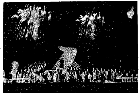
Widokowiec „Noc czterech wieków” na Wiśle w Warszawie, ku uczczeniu rocznicy Miłobędzkiej, Stróżkowskiej, Chopina i Żelaznego. W tle: mosty nad Wisłą podświetlone wspaniałą dekoracją barok, sztukaterie cudownej urody i meandry szesnastowiecznej katedry św. Kazimierza. Kapryśna zgrzyda — Złoty