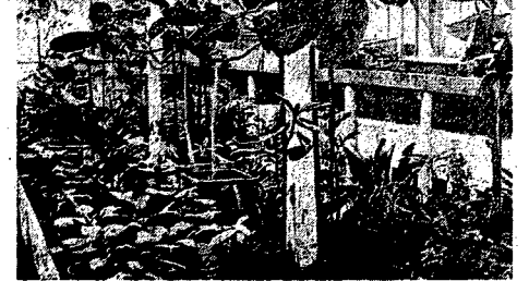
Ogrodniki w „stanowiskach” drzewa obnoszącego.

Z powodzeniem też kultywuje się cały szereg roślin podzwrotnikowych, dających w obfitości tłuszcze jadalne i przemysłowe oraz olejki pachnące do wyrobów perfumeryjnych. W tym celu się już na północy drzewa eukaliptusowe, wysuszające bagno i dostarczające cennego drewna dla przemysłu, rośliny lekarskie, drzewa kokalajnowe, chinowe, kamforowe, aloes itp. L. S.