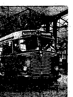
Wskazywał parę... w pierwszym planie, który wyznacza ścieżkę...