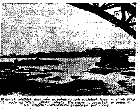
Walekiet wioślących deszczem w pobudowanych częściach...