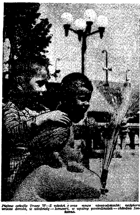
Wielki elewator w Mariensztacie. W tle widoczny jest kościół, a w pierwszym planie - chłopi z rodzinami.

(Od specjalnego wysłannika API da Ljczy)