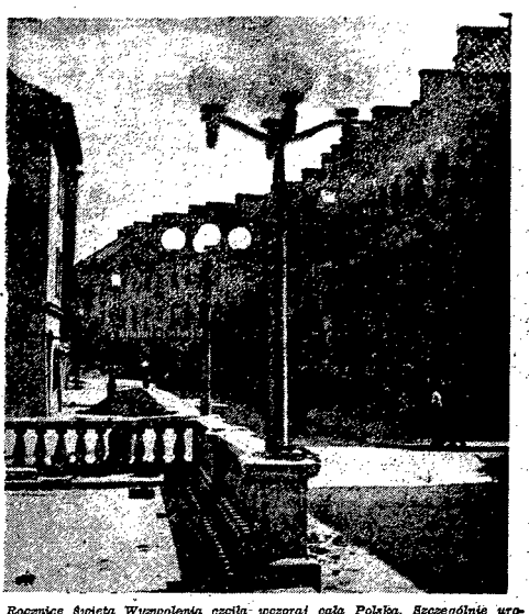
Rocznice Święta Wyzwolenia uczła uroczaj cała Polska. Szczególnie uroczajnie obchodzila ten dzień Warszawa, tu bowiem koncentrowaly się najwazniejsze uroczystosci: otworze kielisza, odsłonięcie pomnika — Kopernika i Żygmunta, oraz odsłonię do zjazdu uroczajny oddział Komunistycznej Trasy W-Z, której budowniczy dokonaj Prezydent R.P. Boleslaw Bieruta.