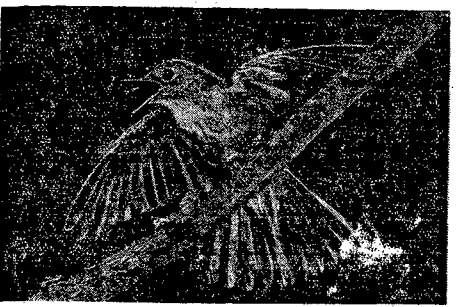
W czerwcowe noce, zwąbkło około godziny 12-iej śpiewa słowik, najsłabszy... w czerwcu...