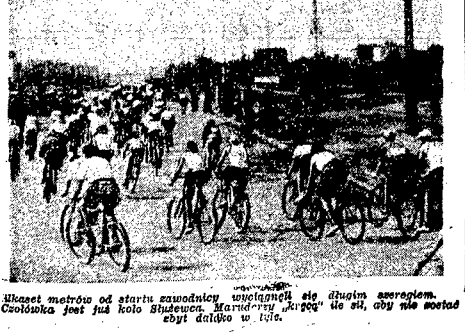
Wzrost metrom od startu zawodnicy wylgnęli się drugim szeregiem. Człowiek jest już kolo Stulecia. Maridow „Kryzys” do 40, aby nie pozostał być takim.