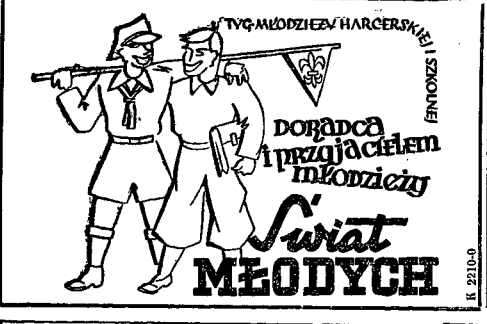
Tęcza przyjaźni i porozumienia