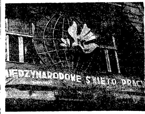
Dekoracje na Nowym Świecie