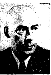
NA STR. 2 ZAMIESZCZAMY REFERAT PREMIERA JÓZEF CYRANKIEWICZA, WYGLOSZONY NA PLANARNYM ZEBRANIU KC PZPR W DN. 20 BM.