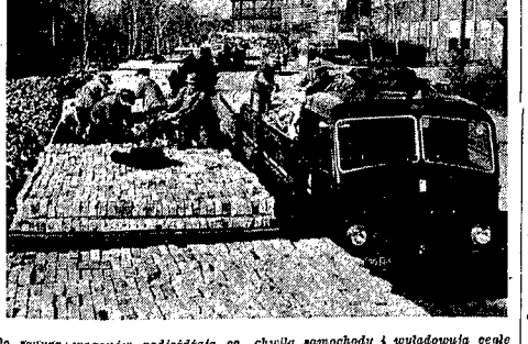
Do stowozu wagonów podjeżdżają co chwila samochody i uprowadzają stowozy i tosiobniki rabin Wrocławia. 300 wagonów nio dzieńnie jedzie „na pomoc” do Warszawy.