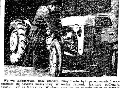
We wsi Babuszewo, pow. polski, znajduje się ośrodek maszynowy. W ośrodku tym są 3 traktory. W ciągu...