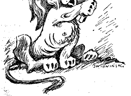
Lew brytyjski do siebie: — No — i jak ja teraz wyglądam?

Pod niepowodzeniem akcji weteranów do armii angielskiej.