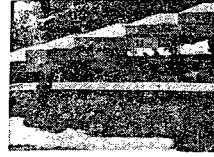
11 marca 1976 r. w fabryce Semperit w Krakowie... 12 marca 1976 r. w fabryce Semperit w Krakowie...