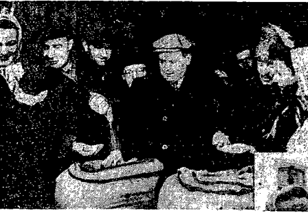
W kołchozie im. Budiennego w obwodzie odeskim jeden z inicjatorów ruchu kołchozowego na Ukrainie Makar Pomiatny pokazując rolnikom polskim ziarno siewne.