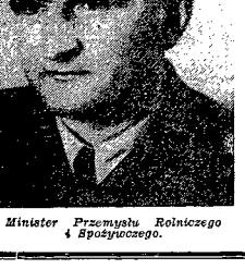
Minister Przemysłu Rolniczego i Spójności.