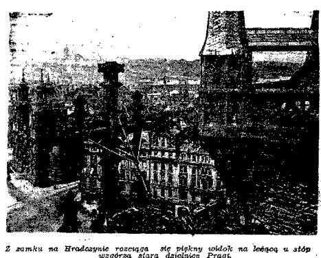
Z zamku na Hradczynie rozciąga się piękny widok na leżącą u stóp ujęzdrza starą dzielnicy Pragi.