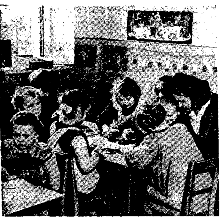
Więcej kobiet, których rodzice osiedli na rozparcelowanym majątku w Kocielnie koło Płocka, spędza prawną opiekę Ligi Kobiet w swoim domu, zamieszkanym na przodzie.