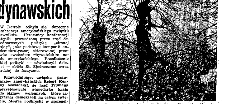
Nieprzełeczone tłumy zebrały się na Vaclavskym Naměstí. Nawet na drzewach siedzą ludzie. Reakcja niechłobowicza została ostatecznie zdławiła. Wielki pochód przebiegał ulicami Pragi.