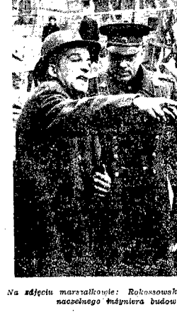
Na zdjęciu marszałek: Rokossowski i Zymierski wstępują do budynku, naczelnego biura planu budowy i trasy W-2, Sigtuna.