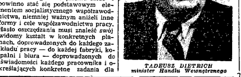
TADEUSZ DIETRICH minister Handlu Wewnętrznego

Dokroczna działalność ministra Han- dlu Wewnętrznego, którego urząd po- stępuje w związku ze zmianami w or- ganizacji naczelnych władz gospodar- ki narodowej — należą wszystkie