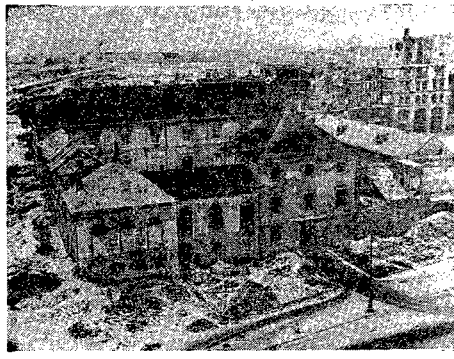
Historyczny warszawski Arsenał na ul. Długiej został już zupełnie odremontowany. Oczeka go wciąż morze gruszo getta.