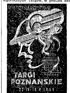
Plakat kolorowy XXII Międzynarodowych Targów Poznańskich, wykonany przez artystę grafika Eduarda Feldmanna.