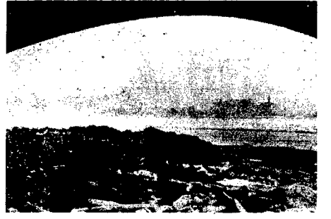
Na 3 km. w górę od mostu Pontatowskiego utworzyła się na Wiśle pokrywa lodowa. Widać przy samym brzegu wody w miejscach, gdzie lód się rozpada. Niedługo należy oczekiwać już drawie go spływu lodu w tej formie. Na zdjęciu: zwalę przy wystrzeleniu na brzeg mostem Pontatowskiego.