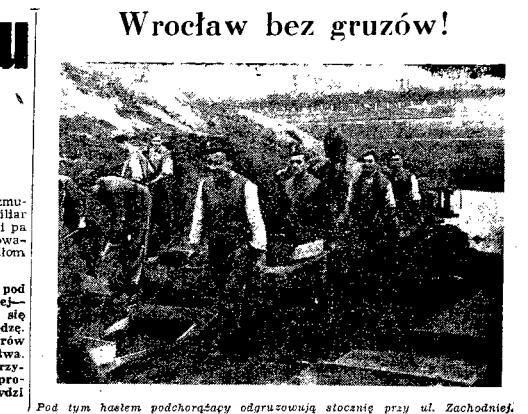
Pod tym hasłem podchorążacy odgruzowują stolicę przy ul. Zachodniej.

Stosunek sil zmienił się wyraźnie na korzyść socjalizmu, demokracji i pokój. Wraz z Zw. Radzieckim i demokracjami ludowymi walczą o pokój i sily demokracji wszystkich narodów. Narząd francuski — podkreślił Thorez — zdaje sobie doskonale sprawę z tego co kosztowała go w swoim czasie polityka antyradziecka. Dlatego Francuzi oceniali ją pełni znaczenia przynależąca do polityki antyradzieckiej, która jest koniec niosła historyczną.