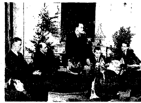
W Nieborowie obraduje zjazd filmowców czechosłowacko - polskich. Na zdjęciu: Prezydium zjazdu.