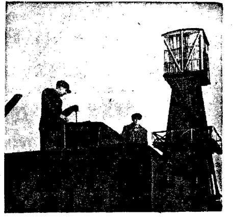
Żyby naftowy pracuje dzięki napędzaniem z Glinnika. (Do reportażu obok).