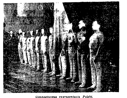
Gimnastyka reprezentacji Polskiej.

W jeździe mężczyzn startuje 47-miu zawodników, a w konkurencji żeńskiej - 12 pań. Warunki na trasie są dosyć ciężkie, gdyż od wczesną padał śnieg. Spadło 30 cm. świeżego śniegu.