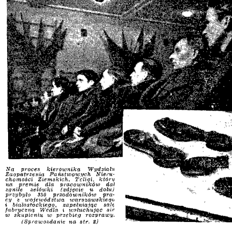
Na proces kierownika Wydziału Zaopatrzenia Państwowego...