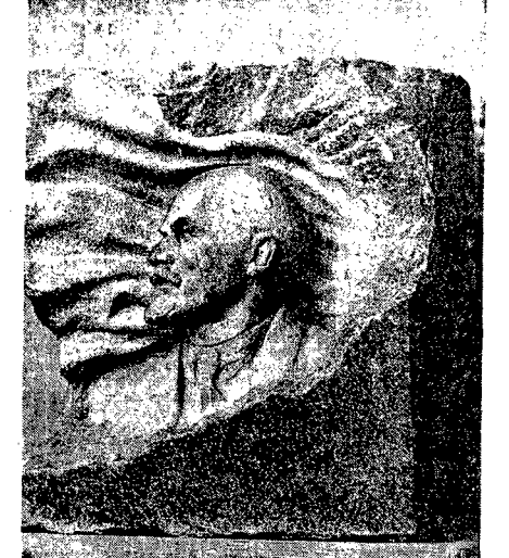
21 lat, minęło 25 lat od śmierci Włodzimierza Lenina, genialnego teoretyka i wielkiego redaktora idei socjalizmu. Idee Lenina stały się drogowskazem dla narodu Związku Radzieckiego, dla wszystkich narodów budujących socjalizm i dla setek milionów pracujących, walczących na całym świecie o lepszą dolę i wolność.