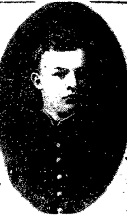
Uczeń gimnazjum 8 klasy w r. 1887