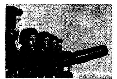
Zaloga polskiego czołgu „aspizuje się do deflady.”