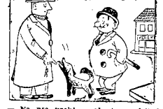
Na psa urok - ale teraz, jak już... Na psa urok - ale teraz, jak już...