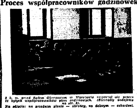
8 b. m. przed Radą Odbudowy to Warszawa rozpoczął się proces 11 byłych współpracowników planu odbudowy. (Odczytu bodajemu. Nie odjeżdża na przednim planie — obrotny, na dalszym — oskarżeni.

LONDON (PAP). Daily Telegraph donosi, że Scotland Yard wykrył dochodzenie w sprawie nadużycia, wykrytych w ministerstwie handlu.