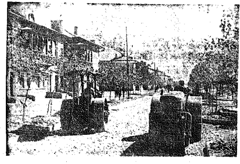
Budownictwo mieszkaniowe w Zw. Radzieckim rozwija się na wielką skalę. Mechanizacja robot budowlanych pozwala na szybki budowę całych kolonii...

Prócz tego wyróżnienie otrzymała f-ma „Specjal” przy ul. Marszałkowskiej Nr 97-a. K 19418-1