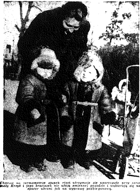
Choć na termometrze słupki wody utrzymują się wprost przeciwnie, widać widać, że woda w jeziorze nie ufała zmianie poziomu i uderzyła na spacer ubrani jak na wyprawie podbiegunowej.