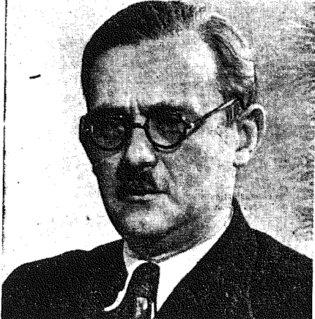
Minister Hilary Minc.

W dn. 18 h. m. sesję popołudniową 4-go dnia Kongresu Zjednoczeniowego wypełnił prawie 5-godzinne przemówienie Min. Hilarego Minca, który podał głębokiej analizie dotychczasowe osiągnięcia gospodarki Polski Ludowej oraz omówił wytyczne planu 6-letniego. Przemówienie to podjęmy w obszernym streszczeniu.