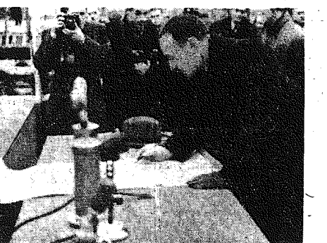
W rocznicę położenia kamienia węgielnego pod budowę Domu Polskiej Zjednoczonej Partii Robotniczej w Warszawie...