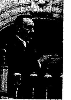
Bolesław Bierut na trybunie