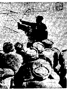
Wojownicy Armii Ludowej Chin. W tle widoczny jest samolot...