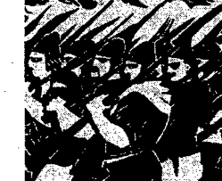
Gyula Derkovits — znakomity malarz węgierski — zdobył sobie szacunkowy rygiel...