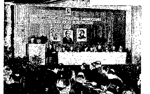
Na terenie Warszawy, obranie takie odbyło się w niedzielę w dzielnicy Warszawa-Północ, na którym wybrano delegatów PPR na spjazd.

Podał on także oficjalnie do wiadomości, że w związku z akcją strajkową aresztowano 1.041 osobę, w tym 117 członków, przeważnie Polaków i Włochów.