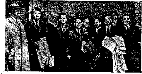
W najbliższym czasie przed sądem w Siedlcach Złodzieńskie sienie 12 Am... (Dziennik)