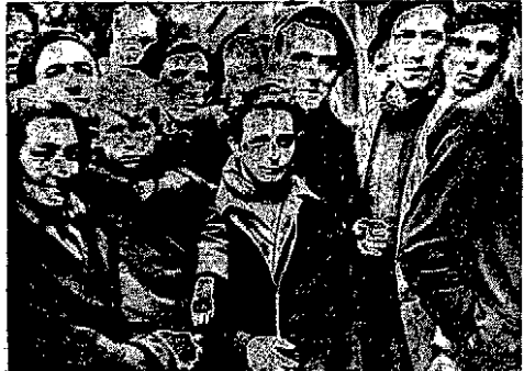
Złota ciła o tygodniowym przyroście i kierująca się oszczędnością, do odkrycia węgla Bethuna. Przed chwilą jeszcze był wyciętym narostem osłoniętym za pikietowaniem kopalczy...