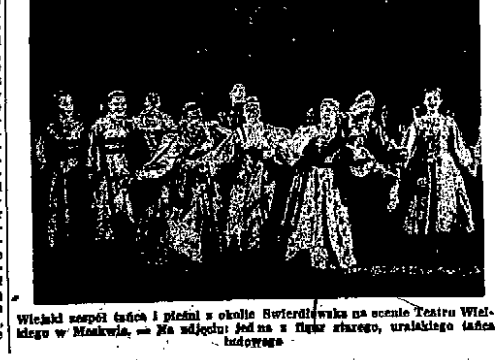
Wielki zespół tańca i pieśni o sztuki Swierdłowska na scenie Teatru Wileńskiego w Moskwie. — Na wleku led na i Nigie szarego, uśmiechniętego.

Wszelkiego rodzaju koncerty popularne i umuzykalsinacje, wydawnictwa i prelekcje na tematy muzyczne tylko częściowo mogą tu pomóc. Konieczne jest wzięcie całego narodu za sprawcę stworzenia i spopularyzowania polskiej pieśni masowej. Dotychczasowe próby nie daly jeszcze oczekiwanych rezultatów, operowały się bowiem nie zawsze na najwłaściwszych zasadach stworzenia muzyki ludowej nie wystarczy — pieśń, która ma pójść w lud, musi się opierać na ideologicznie bliskich ludowi lekach poetyckich i wyprawać muzykę z wątków bliskich muzyce ludowej. Będą śpiewane przez lud i przędzą do jego skarbicy tylko te pieśni, które będą odpowiadały tym warunkom. A. H.