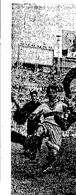
Zespoły piłkarskie o sukces ZSRR przyjęły sukces drużyny CDBA. Jedną z nich była drużyna zwycięzcy swojego najdroższego przeciwnika — Dyhamo (Moskwa). Na zdjęciu naprzeciwko Dyhamo odaje efektowny strzał na bramkę CDBA.

Zdobyte odznaki jest w wielu przypadkach obowiązkowe. Np. w halskach zawodowców i zdobywcia odznaki zalety stypendium i przysła do następnego klasy. Odznaka