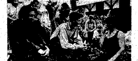
Praca na roli jest ciężka, ale kiedy tylko zbiorzy, dopiąz, humor. Oto grupa robotników maglika pasterzowego...