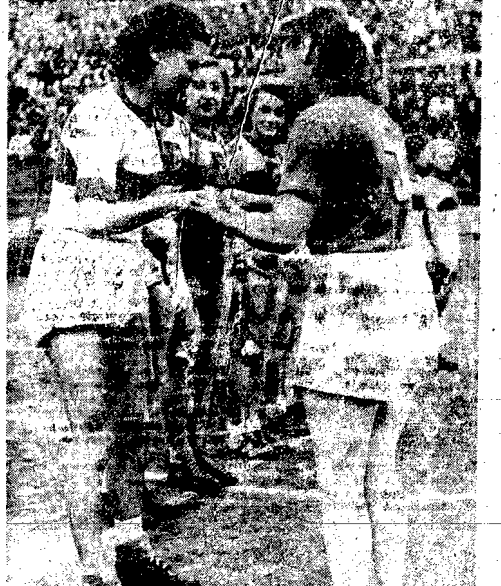
Na kortach tenisowych Leśny w Warszawie odbyło się spotkanie koszykarek: reprezentacji Moskwy i Warszawy. W otoczeniu kapturów drużyny wprawno-skiej pamiętkowy propagandysta.