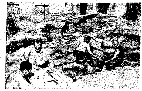
Na terenie podwórka Zamku Szczecińskiego prowadzone są obecnie badania mające na celu odzyskanie dawnej siedziby słowiańskiej...