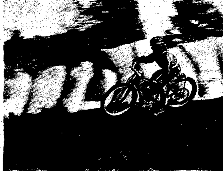
Fragment wyścigów motocyklowych na torze żużlowym, w którym Polacy pokonali Czechosłowację 75:73.