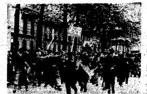
Przez Francję przeleciała się potężna fala strajków, skierowanych przeciwko rządowi i planowi Marshalla. Od powstania rządu się rozpoczęło. Tłumy robotników rozprószyły się, jakby zgnębione, w kierunku południowym. Do ogólnego i pacyfikacji. W kraju zapadła manifestacja robotniczych na pl. Anquetina w Paryżu.