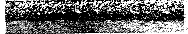
Niezwykły widok „miast” flamingów na terenach bagnistych delty Rodanu.