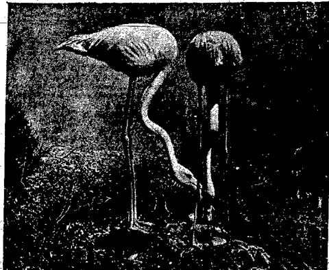
Różowy kolor przesłania do barwnym pierzonymi ptaków - flamingów.