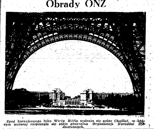
Spód koronkowego łuku Wiczy Eiffa widać się pałac Chailhot, w którym wczoraj rozpoczęła się sesja generalna Organizacji Narodów Zjednoczonych.

Mówiła o sytuacji międzynarodowej w jej 8 klatce po zwyciężeniu Narodów Zjednoczonych „Auriol stwierdził, że istnieje ogromna różnica, wywołująca niepokój wśród narodów. Tym większą jest waga roli ONZ, której zadaniem jest zapewnienie pokoju i ludzkości. W końcu Auriol wyraził przekonanie, że nie zostaną zawieszona