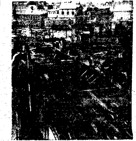
W niedługym czasie prowadzona jest budowa tunelu łączącego trasę W-Z. Zakładano, że wiadukt ziemny obrotowy betonowany są belki, podczas siedziowania spókania.

Organizatorzy imprezy dokładają starania aby nie zawiodła ona pod żadnym względem. Zawody rozpoczną się punktualnie o godz. 11 a już o 8 trasa zostanie zamknięta przez służbę porządkową. Megafony umieszczone na całej