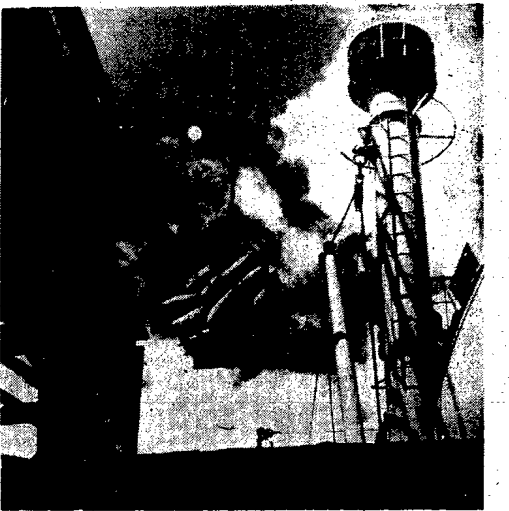
Obługa ładunku przeładunku w naszych portach wstrząsała z mistycyzmem. Każdy dzień, każdy tydzień przynosi nowe czyny bohaterów o sile woli i walecznym sercu na nadbrzeżach. W lipcu wszystkie porty polskie przeładowały ponad 1 i pół mil. ton, przy czym największą tonarostwa została przeładowana w naszym portowym. Główna — Gdynia.