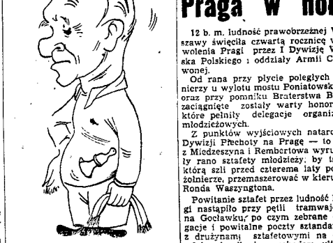
Szymon (retraz. PZL)