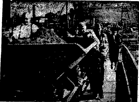
Dotychczasowy Kongres Intelektualistów, bawiony ostatnio w stołecznej, weszli w skład w komisję... (The text is partially obscured and difficult to read fully, but it describes the activities of the Intellectual Congress.)