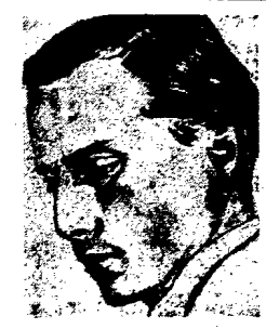
ANDRZEJ PANUFIK kompozytor