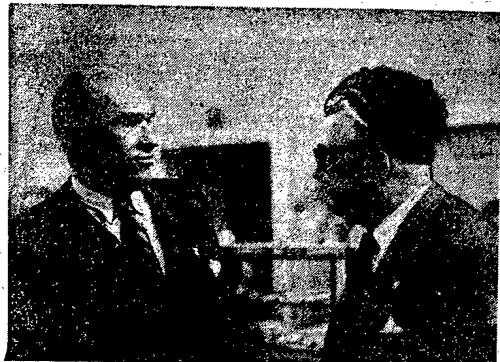
Na dwa tygodnie przed rozpoczęciem Kongresu, do Wrocławia przyjechała delegacja zagranicznych uczonych, pisarzy i artystów...