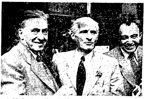
Ilya Erenburg, Julian Tuwim i Aleksander Korniejczuk