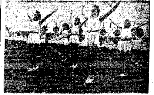
Gymnastyczny polski duet pokazał w czasie Igrzysk Zw. Zaw. Katowicki duet kultury fizycznej uczelni wyższej klasy zawodniczej grupy polskich publiczności.