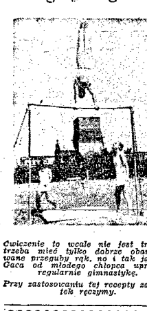
Gwieźdźdźka to cudo nie jest trudne, robić mied tylko dobrze...